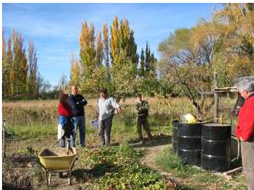
Figura 7. Biodigestor

Cabe recordar el dato de que se trata de proyectos familiares, por lo que no es descartable y seguramente será prioritaria la variante que consiste en destinar el excedente de la producción a la elaboración de subproductos, como dulces, salsas, licores y otros, que son demandados por el mercado.