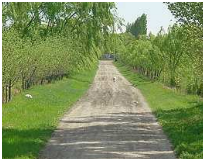
Figura 3. Camino de entrada a Granja Loma Grande