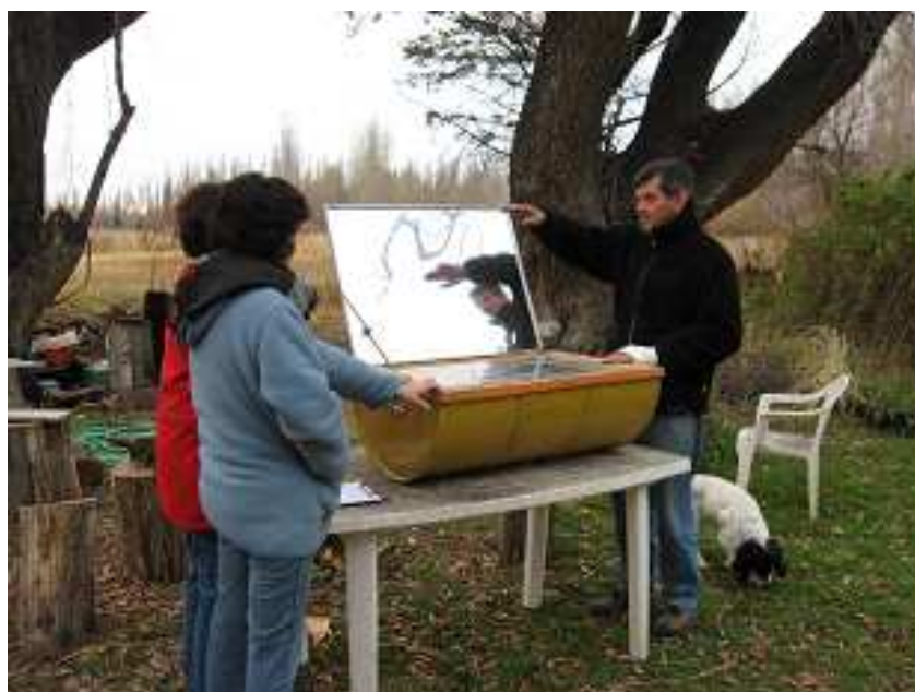
Figura 6. Cocina/horno solar

Se encuentra en estado avanzado de construcción la futura "fabrica" de dulces regionales, que hasta ahora se elaboran en la propia casa de la familia utilizando para la combustión la cocina tradicional a leña. Mediante el convenio llevado a cabo entre el IGEPAT, Instituto de Investigaciones Geográficas de la Patagonia, y los propietarios de la chacra 131, se ha colocado un biodigestor para la producción de biogas, que reemplazará a la leña en la cocina de la fabrica de dulces.; se utiliza el desecho de los conejos y también se ha instalado una cocina tipo horno solar que sirve para cocinar y para calentar agua.