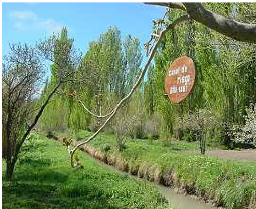
Figura 5. Canal de riego cuya construcción data de 1867