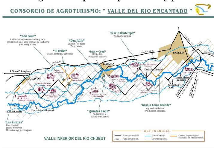
Figura 4. Tríptico de promoción y publicidad

Desde el año 2002, "Granja Loma Grande", de la familia Evans-Aguirre, se dedica a la agricultura natural, la producción orgánica y al agroturismo destacándose la modalidad educativa e interpretativa y en la cual se ha instalado un biodigestor y una cocina/horno solar como alternativa ante la falta de gas natural por red.