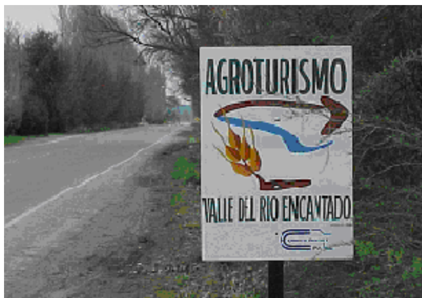
Figura 2. Logo de Identificación del consorcio

La carta de presentación del grupo graficaba la interconexión con otros grupos del mismo perfil distribuidos en la geografía provincial: "...integramos la Red Provincial de Agroturismo compuesta por la Comarca Andina del Paralelo 42, Trevelin, Sarmiento Verde y nuestro consorcio..." "...para intercambiar experiencias, unificar códigos y mantenernos actualizados". Además entre los participantes del consorcio diseñaron un logo que los identificaba.